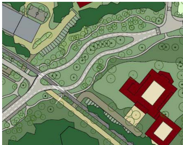
Figuur: Situatie ter hoogte CVK met ook intekening monumentale bomen zoals deze daar thans voorkomen.