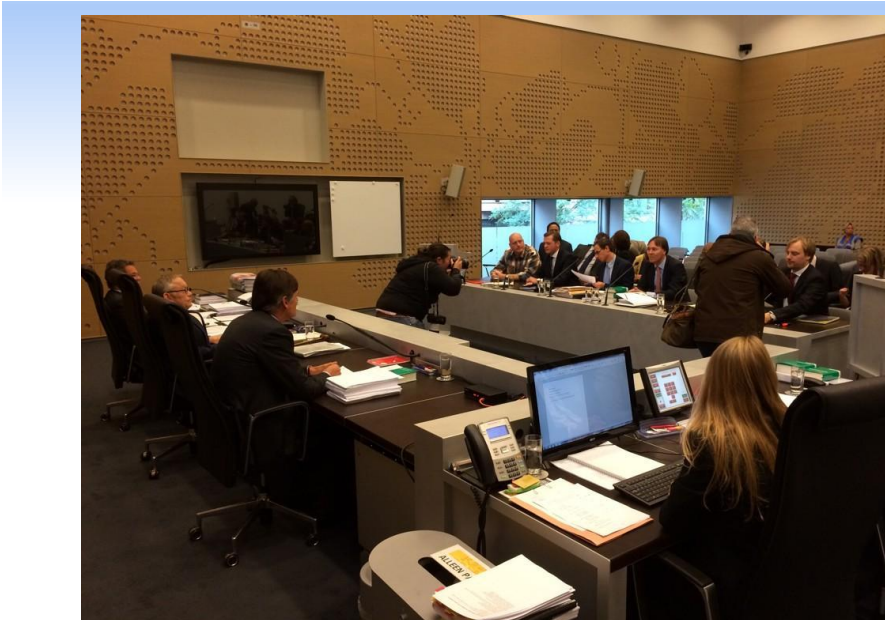
Bron: AT5/Twitter, zitting Zwarte Piet, ABRvS 16 oktober 2014

Vereniging Leefmilieu, 20141107, CCO, beroep bij de bestuursrechter