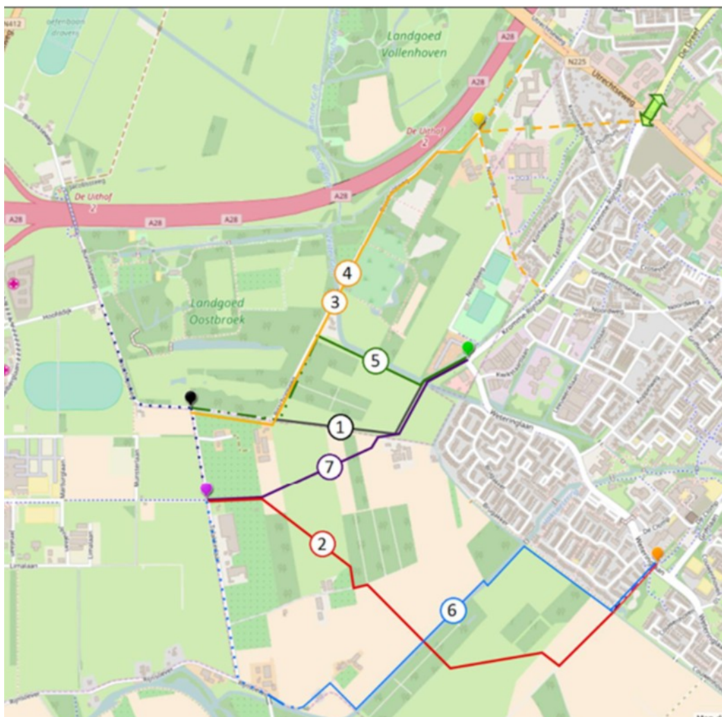
Kaart met varianten onderzoek fietspad USP-Zeist

in de periode 2017-2018 is in het onderzoek naar mogelijke varianten voor een fietspad USP-Zeist onderzoek gedaan naar de effecten op de waarden in het gebied. Met dit onderzoek als basis wordt in deze eerste stap samen met de te betrekken partijen bekeken welke onderzoeken nog meer zijn uitgevoerd en of aanvullende onderzoeken nodig zijn. Deze stap resulteert in een objectief beeld van de waarden in het gebied.