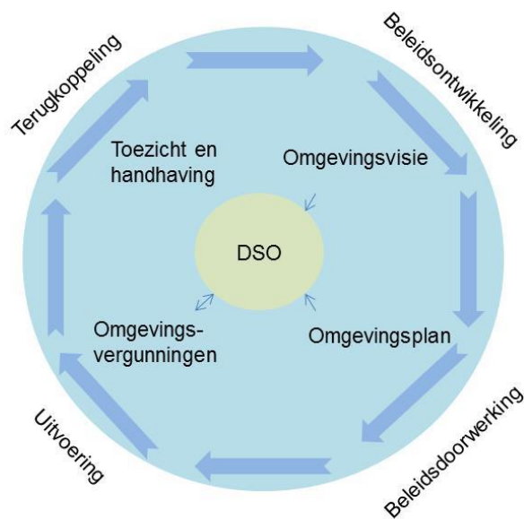
figuur 2: samenhang kerninstrumenten

In de bovenstaande afbeelding is de samenhang tussen de drie lokale kerninstrumenten, omgevingsvisie, omgevingsplan en DSO, weergegeven aan de hand van de beleidscyclus binnen de fysieke leefomgeving. Het DSO is hierbinnen het centrale loket richting samenleving en overheidsorganisaties, waarin de kerninstrumenten, zoals de omgevingsvisie en omgevingsplan, zichtbaar zijn, maar ook het centrale loket waarin de samenleving haar vergunningsaanvragen of meldingen kan indienen.