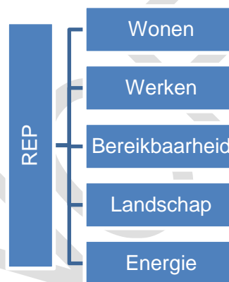
Figuur 1: REP integrerend kader voor regionale afwegingen tot 2040