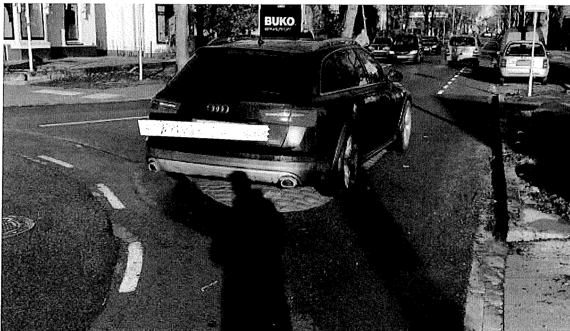
Foto 1 – Door ons regelmatig gesignaleerd gedrag m.b.t. het verdrijvingsvlak