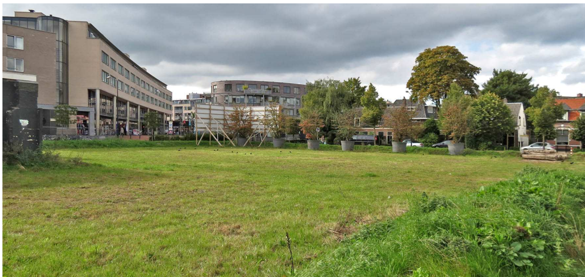
Gezien vanaf het er naast/achter gelegen parkeerterreintje