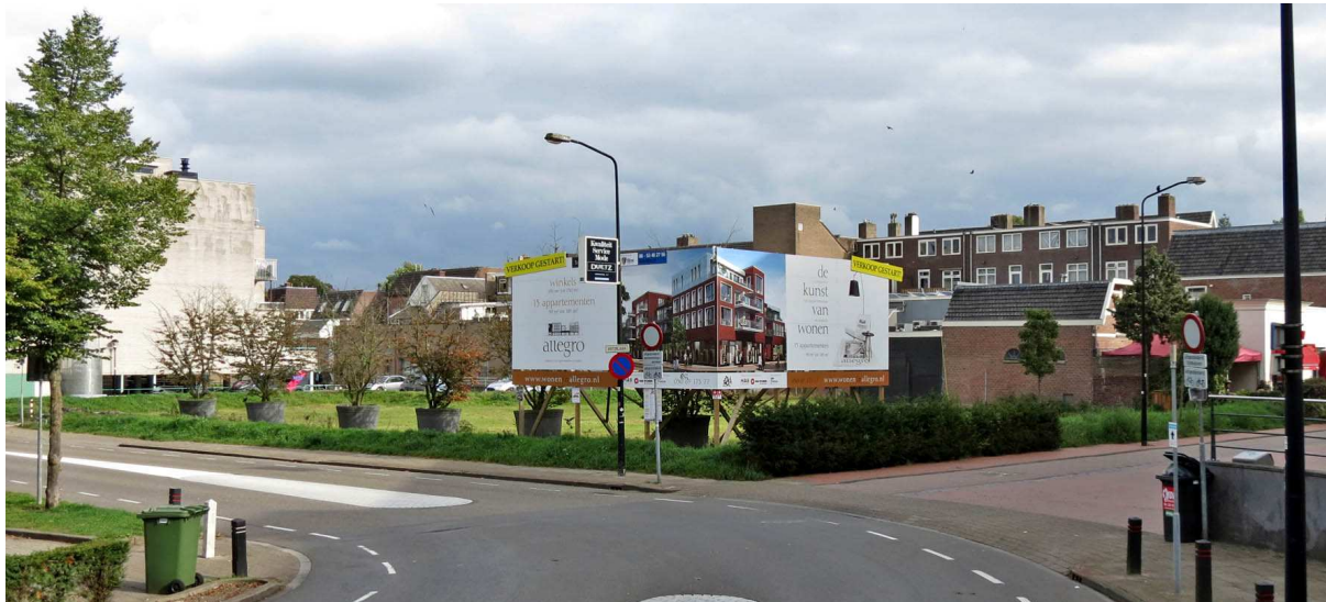
Gezien vanaf het Belcour

Onderstaande foto's tonen het terrein zoals het er nu (oktober 2013) bij ligt.