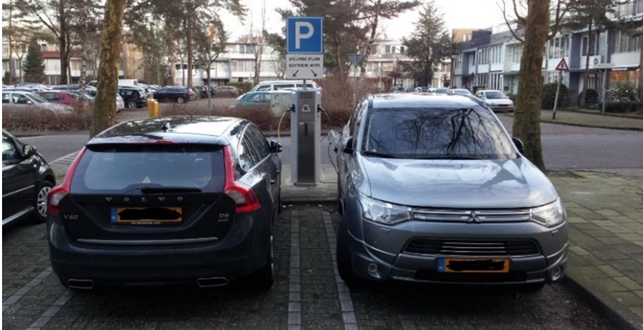
Zeist faciliteert elektrische auto's met oplaadvoorzieningen in de openbare ruimte.

Dilemma's op deze pijler zijn bijvoorbeeld: haal je bomen weg om meer rendement te halen uit zonne-energie? 2 Stook je CO 2 -neutraal hout, waarmee je de luchtkwaliteit onder druk zet met meer fijnstof? 3 Gelukkig zijn er vooral ook genoeg kansen.