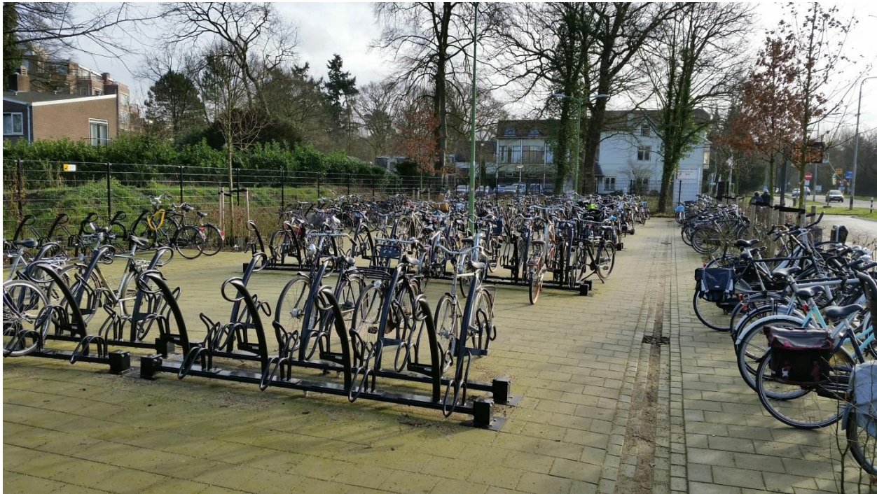
Goede stalling, zoals bij de bushalte langs de Utrechtseweg bij het Herman Jordanlyceum, zorgen ervoor dat mensen eerder kiezen voor OV en fiets, in plaats van voor de auto.